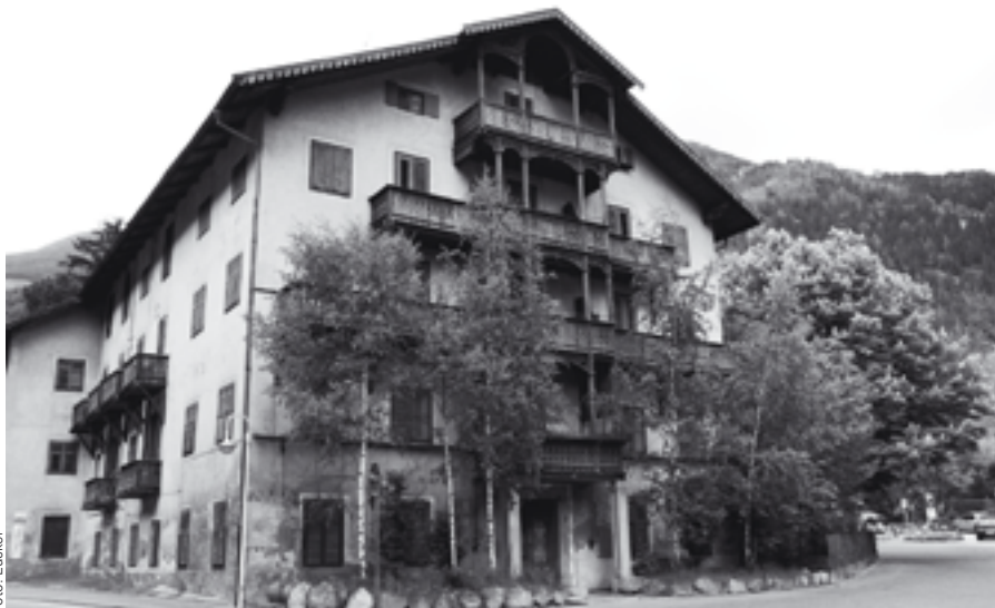
L'ex albergo Posta: nella struttura risanata prenderà vita la "casa delle innovazioni".

Fa ancora parte del progetto energetico del comune di Campo Tures la realizzazione di un centro di innovazione dell'energia. La casa che ospiterà questo centro è stata individuata nell'antica, tradizionale costruzione dell'ex albergo Posta all'entrata del paese di Campo Tures.