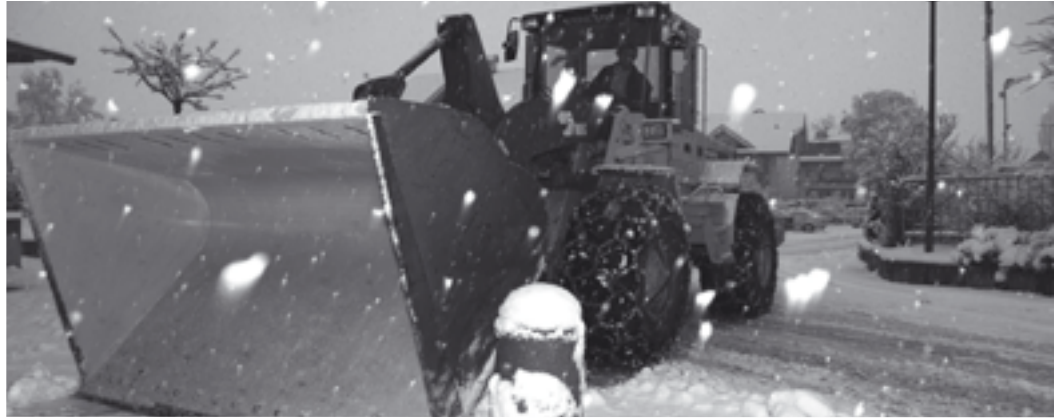
Macchine pesanti: lo sgombero della neve a Campo Tures non è cosa per tutti.

La neve quest'anno è arrivata in ritardo, molto in ritardo, ed è anche arrivata in modo piuttosto esiguo. Ma non appena è scesa la neve si è ripetuto il solito e spiacevole problema del suo sgombero. Le montagne di lamentele a riguardo hanno superato notevolmente le piccole montagne create dalla folta coltre bianca. Il problema è sempre lo stesso: come sgombrare le strade dalla neve per fare tutti felici? Singolarmente alcune lamentele potranno anche essere state motivate, tuttavia è da sottolineare che molto spesso i disagi creati da questa situazione sono da imputare direttamente ai comportamenti di alcuni cittadini. La neve è un regalo di Dio fatto a noi tutti. Gli operai comunali e le aziende incaricate per lo sgombero si impegnano a fondo per liberare dalla neve il più presto possibile strade, stradine e piazze. Molto spesso però i singoli cittadini prendono iniziativa autonoma e liberano i propri terrazzi, giardini e aiuole dalla neve, riversandola però sulle strade e le piazze appena ripulite. La richiesta rivolta al comune di liberare nuovamente queste aree diventa un paradosso senza fine. La